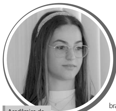
Acadêmica de Medicina/UFS