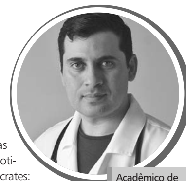
Acadêmico de Medicina/UFS

A faculdade de medicina é uma trilha ao cume longa e árdua. Neste caminho encontram-se rochas duras, trechos acidentados, além de belas paisagens. Porém, toda trilha pode ser mais segura, inclusiva e proveitosa; desde que tenha pessoas que dividem os fardos, companheiros que motivam e guias que mostram o melhor caminho. Que sejamos guias e companheiros motivadores e inclusivos seguindo o aforismo atribuído à Hipócrates: “Curar algumas vezes, aliviar muitas vezes e consolar sempre”.