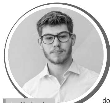
Acadêmico de Medicina/UFS