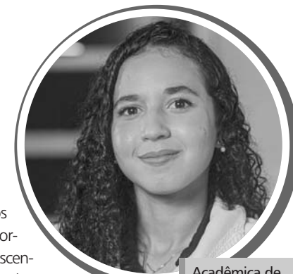
Acadêmica de Medicina/UFS

Na primeira semana do curso de Medicina, estamos eufóricos com a ideia de vestir um jaleco e aprendermos a ser médicos, mas logo nos deparamos com desafios: a graduação exige um estudo distinto, pois se sair bem nas provas teóricas já não é suficiente. Diante disso, é imprescindível buscar uma formação holística, que se valha de algumas estratégias: a atuação em projetos de extensão, de pesquisa e em programas de monitoria, que auxiliem o discente no desenvolvimento de habilidades extracurriculares, transcendendo o espectro teórico. Afinal, o médico que só sabe de medicina, nem de medicina sabe.