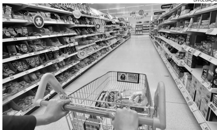
■ Abrasmercado , indicador que mede a variação de preços de 35 produtos de largo consumo, registrou alta de 2,20% em março

Entre os produtos básicos, a principal elevação foi do feijão (15,40%), seguido pelo leite longa vida (11,74%). No acumulado do trimestre, o feijão subiu 28,11%,