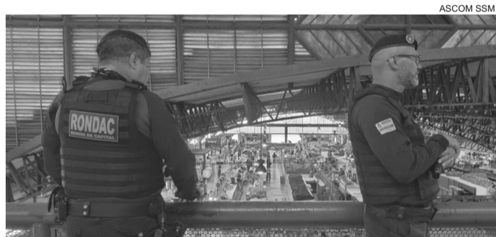
■ Presença da força municipal tem sido cada vez mais solicitada pela população

A Prefeitura de Aracaju, por meio da Secretaria Municipal de Segurança e Cidadania (SSM/AJU), afirma que tem intensificado a segurança nos mercados centrais. A presença da força municipal tem sido cada vez mais solicitada pela população. Os dados operacionais mostram que, em 57% das ocorrências registradas entre janeiro e abril de 2026, o acionamento partiu diretamente da população, por meio do telefone 153.