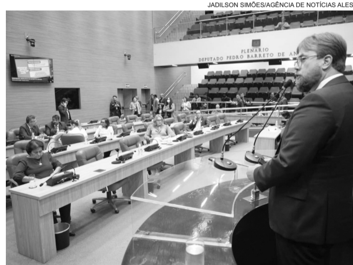
Jorge Teles, secretário de Estado do Trabalho, Emprego e Empreendedorismo falou aos deputados nessa quarta-feira

Ele ressaltou ainda que, em janeiro de 2023, havia 414 mil famílias beneficiárias do programa social e 313 mil trabalhadores com carteira assinada. “Em menos de três anos, conseguimos superar esse hiato com trabalho, parceria institucional e políticas públicas voltadas à