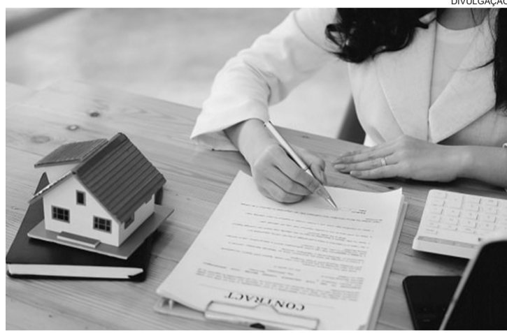
■ No Estado de Sergipe, a carteira imobiliária do Sicredi cresceu 14% em 12 meses

O crescimento ocorre mesmo em um contexto de maior restrição nas condições de financiamento. A taxa básica de juros elevada encarece o crédito e reduz a capacidade de pagamento das famílias. “O que a gente observa é uma demanda que não se retraiu, mesmo com um ambiente de crédito mais