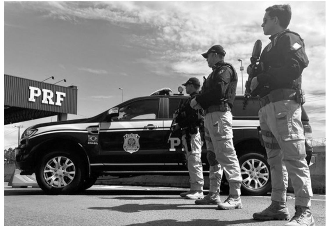
■ Operação Semana Santa 2026, teve início à 0h da quinta-feira, 02/04 e seguiu até às 23h59 do domingo, 05/04.

MESMO COM A REDUÇÃO NOS ACIDENTES GRAVES, HOUVE AUMENTO NO NÚMERO DE PESSOAS FERIDAS EM RELAÇÃO A 2025