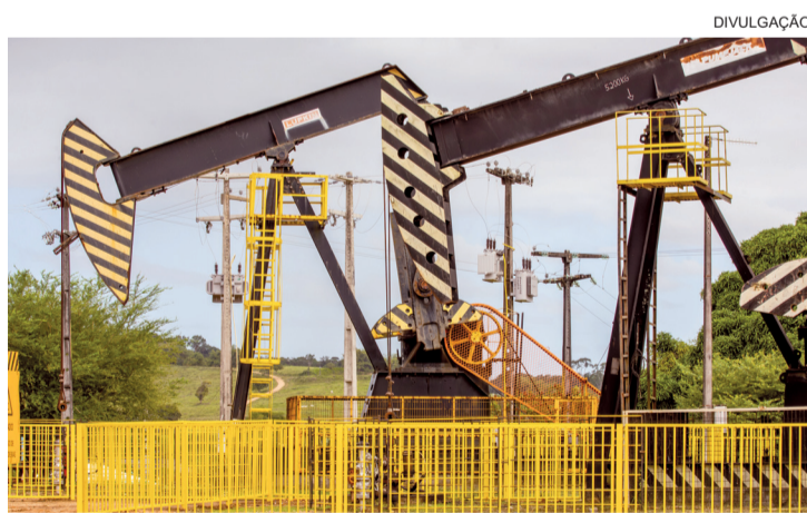
■ Do total produzido no segundo mês de 2026 em Sergipe, 99,4% ou aproximadamente 12,8 mil barris por dia foram extraídos em terra

ou aproximadamente 12,8 mil barris por dia (bpd) foram extraídos em terra. Nesse tipo de produção, em termos relativos, observou-se um aumento de 2,8% na comparação com o mês anterior. Em relação ao volume produzido em fevereiro de 2025, notou-se um acréscimo na produção de 14,6%. Já a produção no mar chegou, em média, a 77,5 barris por dia (bpd), abrangendo 0,6% da produção total. Em termos comparativos, verificou-se retração de 8,9% em relação ao mês de janeiro último. Na comparação com fevereiro de 2025, observou-se um crescimento de 137,3%.