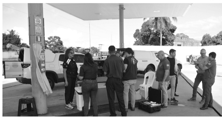
■ Coordenada pela Decon em Sergipe, a operação nacional reúne diferentes órgãos com atribuições complementares