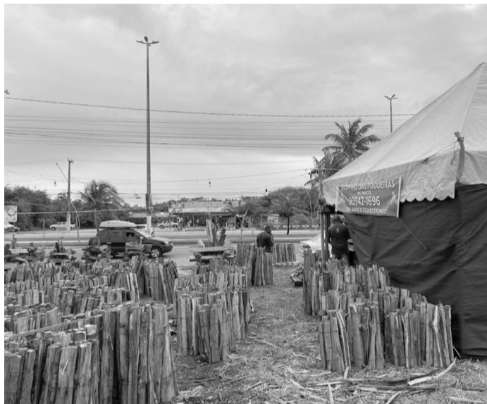
■ Emsurb está recebendo pedidos de autorizações para o funcionamento de barracas de comidas típicas, fogos e fogueiras

Com o período junino se aproximando, a Prefeitura de Aracaju, por meio da Empresa Municipal de Serviços Urbanos (Emsurb), já está recebendo pedidos de autorizações para o funcionamento de barracas de comidas típicas, fogos e fogueiras. O cadastro pode ser realizado na sede da Emsurb, na rua Dom Pedro II, nº 135, de segunda a sexta-feira, das 8h às 12h e das 14h às 17h ou pela plataforma AjuInteligente.