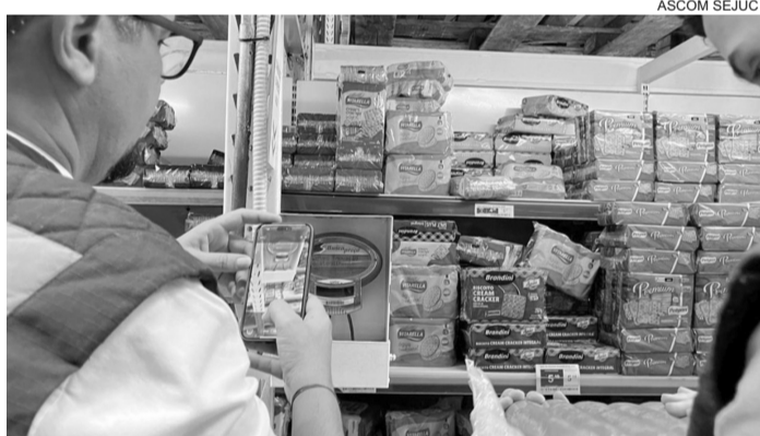
■ Ação foi motivada por denúncia recebida pelo órgão de proteção ao consumidor

O Procon Sergipe autuou nessa quarta-feira, 20/05, um supermercado localizado na Zona de Expansão de Aracaju, durante fiscalização realizada após denúncia de consumidores relacionada à divergência de preços e comercialização de produtos vencidos.