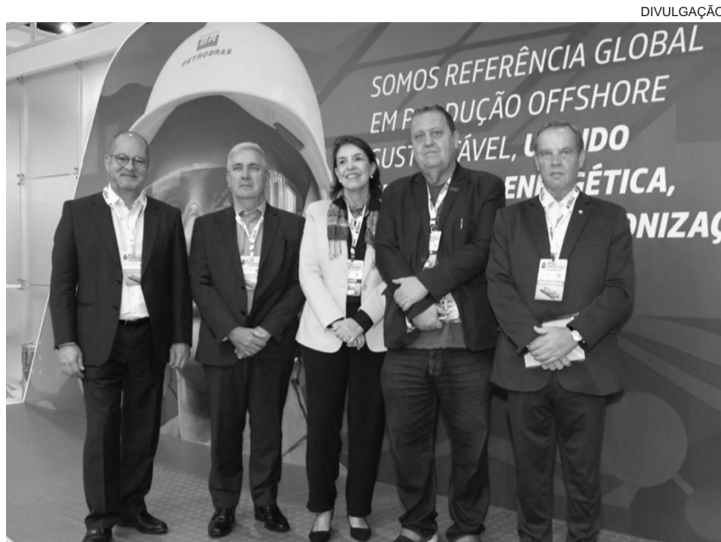
■ Sergipe participa da FPSO Expo 2026, no Rio de Janeiro