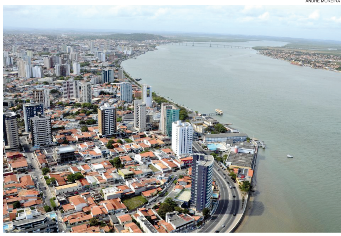
■ Levantamento aponta que Aracaju registrou um avanço em sua pontuação, subindo de 65,73 para 66,35 pontos entre 2025 e 2026

• Estudo Divulgado pelo instituto Imazon em parceria com outras organizações, o estudo avalia a capacidade de uma sociedade em atender às necessidades humanas básicas, garantir bem-estar e ampliar oportunidades para a população. O levantamento analisou os 5.570 municípios brasileiros, incluindo as 27 capitais, utilizando uma escala de 0 a 100. O cálculo é baseado em 57 indicadores sociais e ambientais, extraídos de fontes públicas oficiais como DataSUS, IBGE, Inep e MapBiomias. Os dados são organizados em três grandes dimensões: Necessidades Humanas Básicas (fatores como segurança e moradia); Fundamentos do Bem-estar (acesso à saúde e educação); e Oportunidades (inclusão social e direitos). O destaque da capital sergipana ficou para a dimensão de Oportunidades, na qual Aracaju alcançou a 89ª posição entre os municípios do