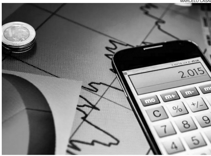
Para alcançar a meta de inflação, o Banco Central usa como principal instrumento a taxa básica de juros, a Selic

De junho de 2025 a março deste ano, a Selic ficou em 15% ao ano, o maior nível em quase 20 anos. O Copom voltou a cortar os juros na reunião passada, num cenário de queda da inflação. No entan-