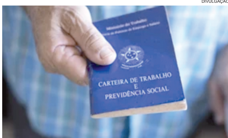
■ Houve um acréscimo de 18,4% no quantitativo de requerentes em relação ao mês de abril de 2025

realizada pelo Observatório da Indústria do Sistema FIES, com base nos dados do Ministério do Trabalho e Emprego. A análise dos dados revelou ainda que os pedidos realizados no quarto mês de 2026 se concentraram principalmente no setor de Serviços (1.887 requerentes ou 31,7% do total), seguido do Comércio, com 23,0% (1.370 requerentes), da Indústria, com 20,5% (1.219 requerentes), da Construção, com