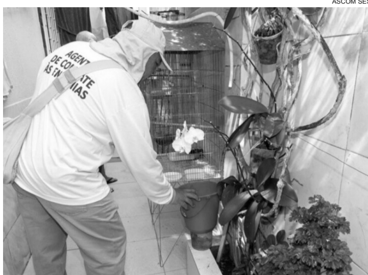
■ LIRAA serve para auxiliar os municípios no combate ao mosquito transmissor da dengue, zika e chikungunya

Sidney Sá reforça que o aumento dos índices de infestação do Aedes aegypti em alguns municípios pode estar relacionado a fatores climáticos. O período chuvoso começou antes do previsto e, aliado às altas temperaturas, contribui para a proliferação do mosquito trans-